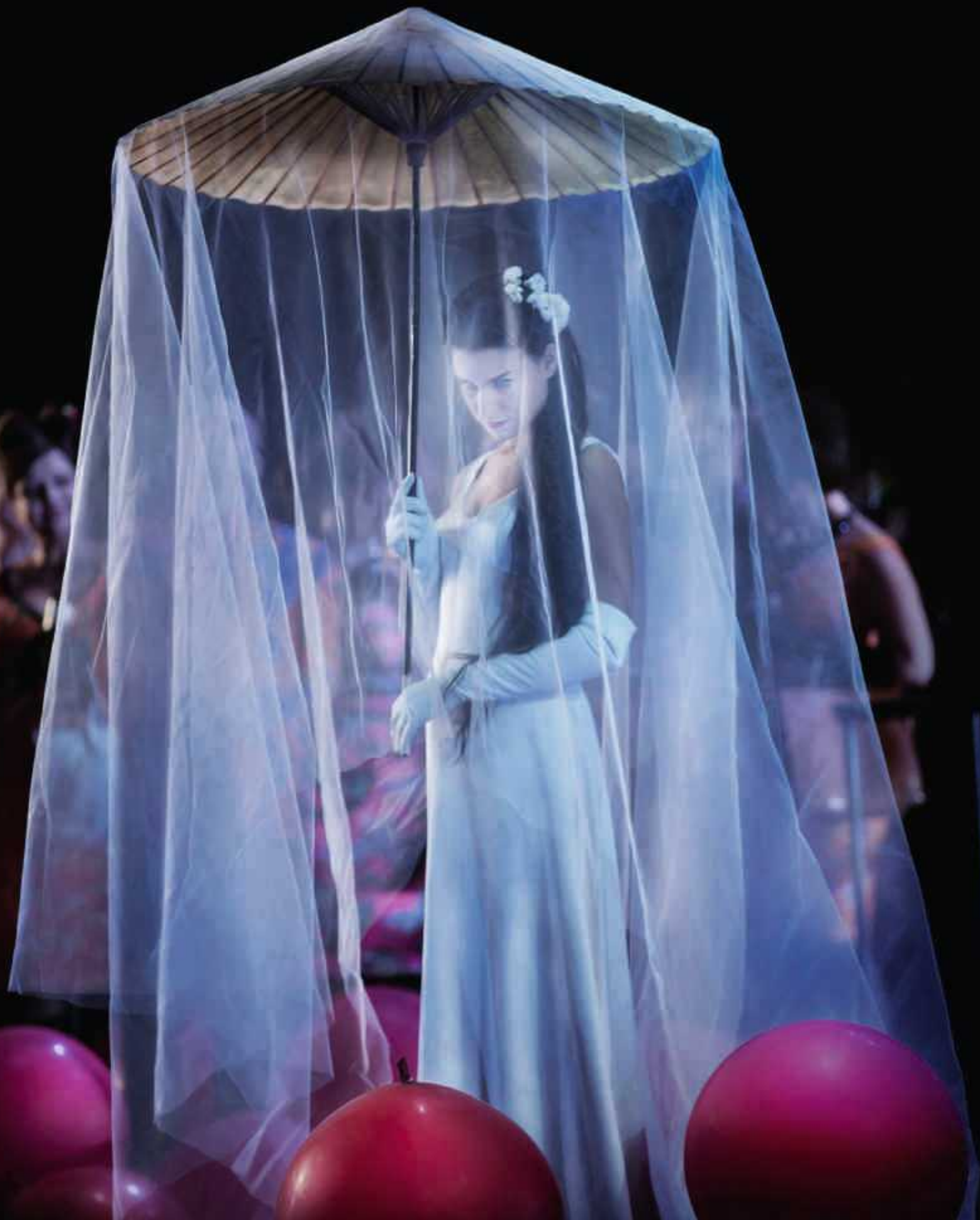
Kungliga Operan är ett av 49 bolag som ägs helt eller delvis av den svenska staten och därmed ytterst av svenska folket. Puccinis Madame Butterfly var en av två operapremiärer på Operan under 2014.